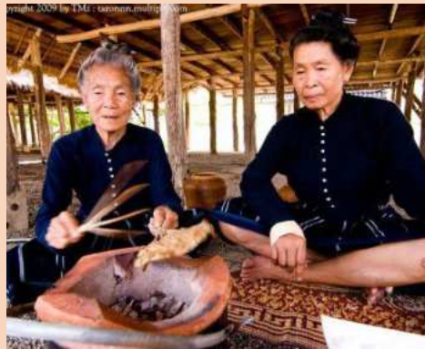
ไทยทรงดำ