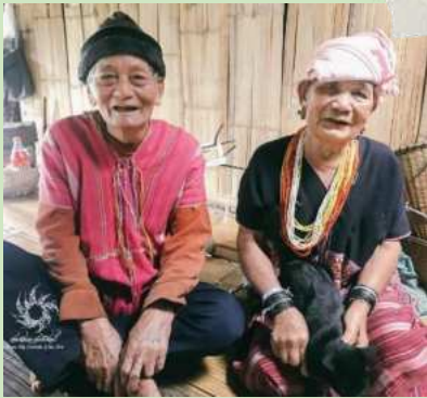
ปกาเกอญอ

กลุ่มที่อยู่อาศัยอยู่บนพื้นที่สูง ปัจจุบันสำรวจได้ 18 กลุ่ม เช่น ปกาเกอญอ ม้ง อีวเมี้ยว ลีซู อ่าข่า เป็นต้น ซึ่งจะตั้งถิ่นฐานตามแนวเทือกเขา และบนพื้นที่สูงทางภาคเหนือและภาคตะวันตกของประเทศไทย มีวิถีชีวิตสังคมเกษตรกรรมที่อาศัยการพึ่งพาธรรมชาติและป่าไม้เป็นหลัก ดำรงชีพด้วยการเก็บหาของป่า จับปลาจากแหล่งน้ำธรรมชาติ ปลูกผักสวนครัว และมีบางส่วนทำงานรับจ้างนอกฤดูการเกษตร